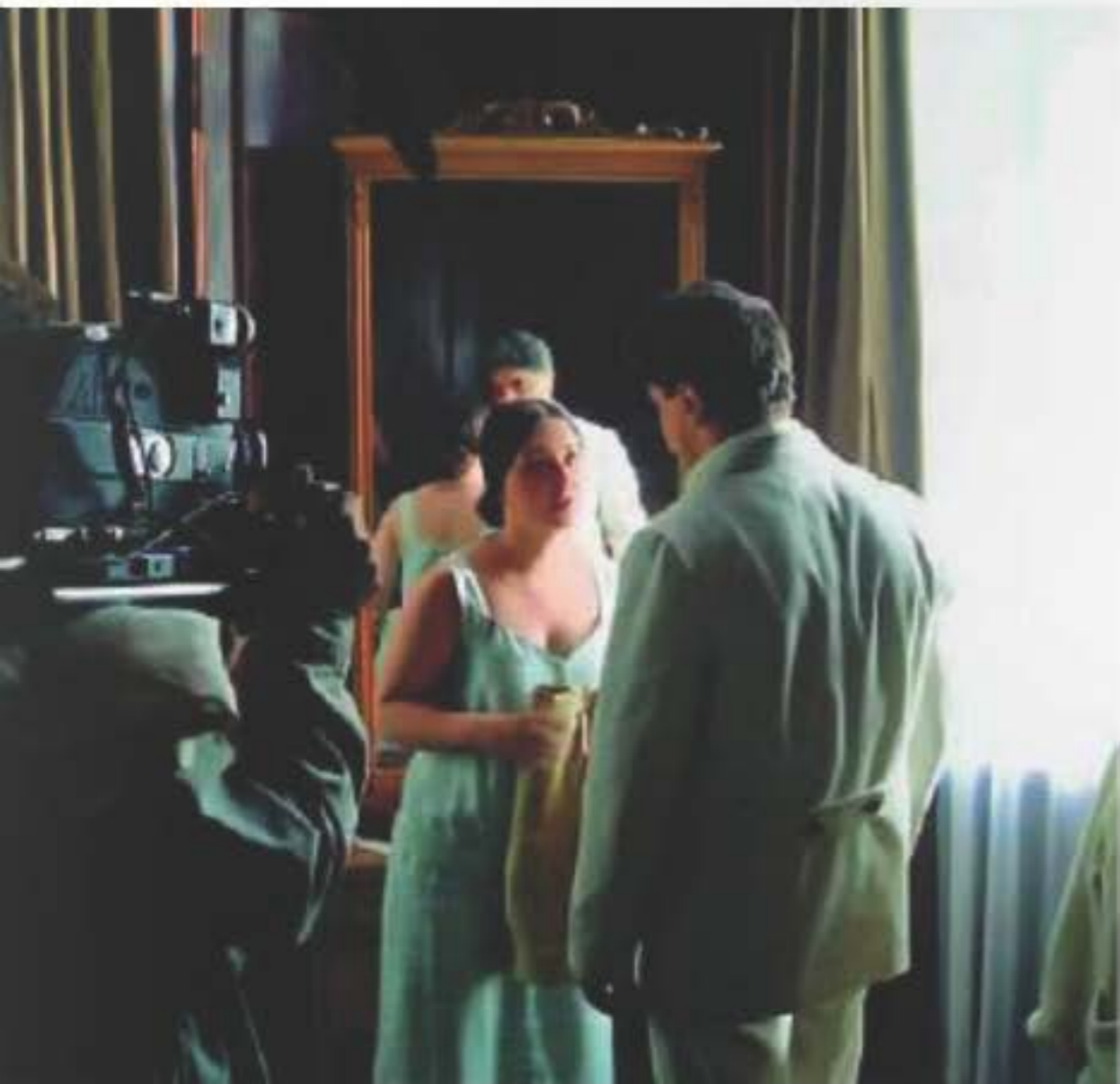
В роли Надежды Аллилуевой

историю семидесятых. После выхода «Границы...» в кино возникла мода на семидесятые, а после бортковской экранизации «Идиота» на телевидении открылись двери для классики. И я очень рада, что имею к этим событиям непосредственное отношение!