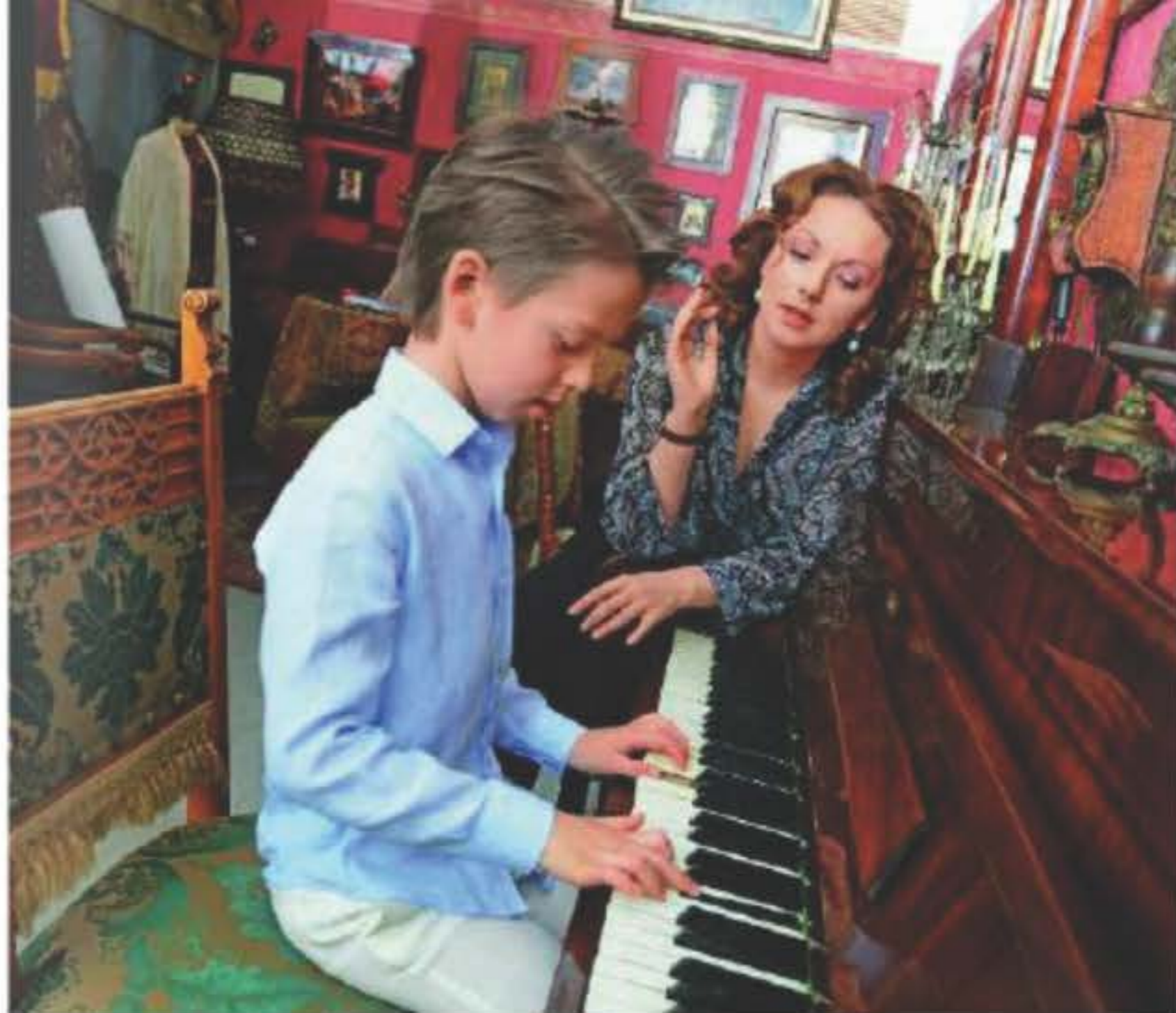
Сын — мой главный защитник

Я думаю, что именно так относился к своей Маргарите великий советский скульптор Сергей Тимофеевич Коненков. Очень трепетно, хотя и скрывал это, очень боялся ее потерять. И именно поэтому она не смогла остаться в Америке с Эйнштейном, которого полюбила и который любил ее до конца своих дней. По крайней мере, я так размышляла над историей их отношений, когда полгода назад го-