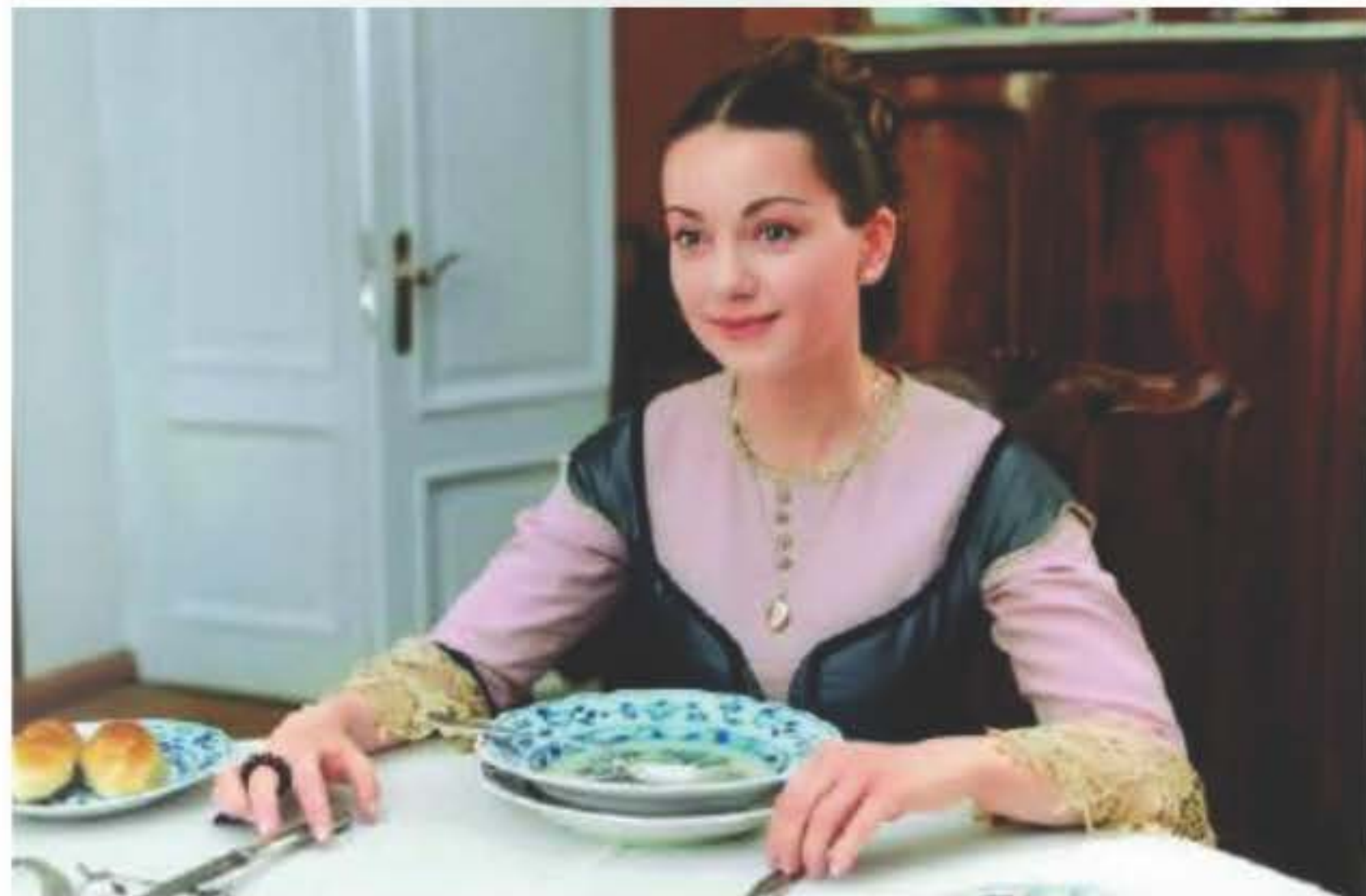
В телекранизации Владимира Бортко «Идиот» по роману Достоевского я играла Аглаю

Но самое ужасное ждало впереди. Митта не давал мне есть, совсем. Обед привозили