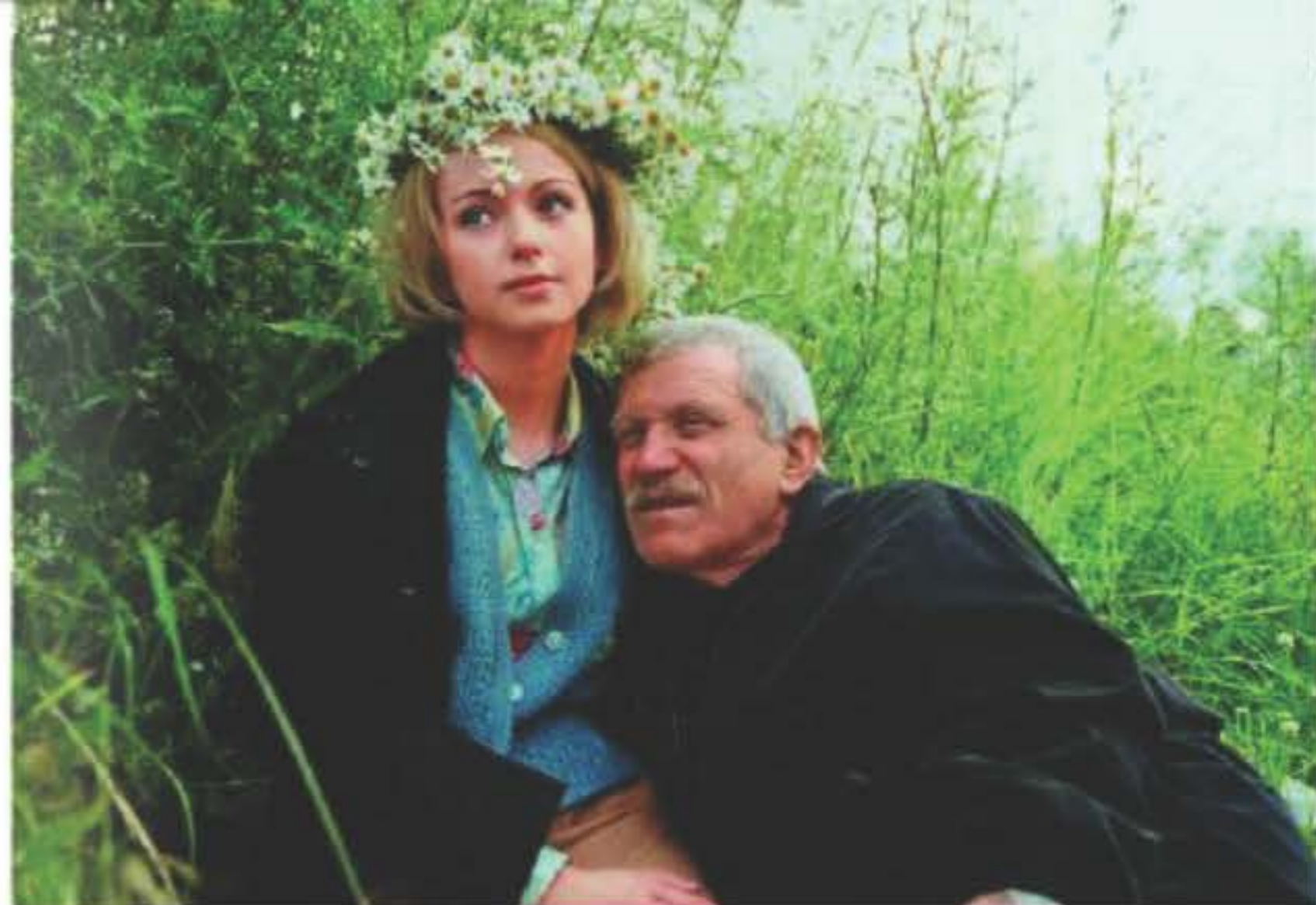
С режиссером Александром Миттой на съемках фильма «Граница. Таежный роман»

От обиды закурила первую сигарету. «Ах, вам не нравится мой голос, — говорило во мне детское чувство мести, — так пусть же он пропадает!» Голос,